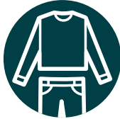
Vêtements amples et couvrants