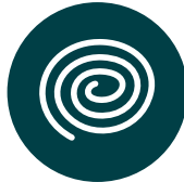
Serpentins à l'extérieur